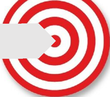
FICHE n°1 : CONCEPTION REALISATION Professionnel qui conçoit le produit et le fait réaliser et installer sous sa responsabilité